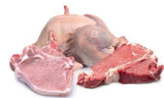
carne de vaca, ave de corral, carne de cerdo

Las correas separadoras de Esband unen materiales únicos con larga experiencia. Su alta calidad es perfecta para su utilización en la industria alimentaria, sobre todo para la separación de cualquier tipo de carne, pescado y verdura. Son los detalles en el proceso de separación que marcan la diferencia y garantizan el éxito. Nuestras correas aportan un resultado óptimo con su flexibilidad y funcionamiento. Además ofrecemos un servicio excelente.