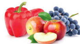
fruta y verdura